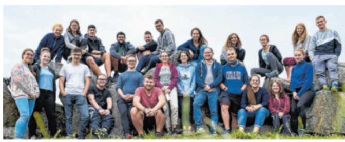
Das Evangelische Jugendwerk Schwäbisch Hall hat verschiedene Angebote für Kinder und Jugendliche.

Das EJW Hall ist eine demokratisch aufgebaute Organisation, dessen Arbeits- und Leitungsgremien von den Delegierten der Kirchengemeinden direkt gewählt werden. Verantwortet wird