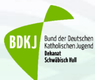
Bund der Deutschen Katholischen Jugend

Aktuell sind im Kreisjugendring Schwäbisch Hall 23 Mitgliedsverbände vertreten: