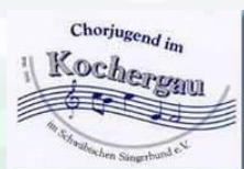
Chorjugend im Kochergau