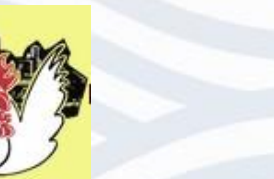
Kleintierzüchterjugend KV Schwäbisch Hall