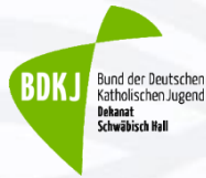
Bund der Deutschen Katholischen Jugend

Aktuell sind im Kreisjugendring Schwäbisch Hall 24 Mitgliedsverbände vertreten: