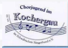
Chorjugend im Kochergau