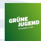
Grüne Jugend Kreisverband Schwäbisch Hall